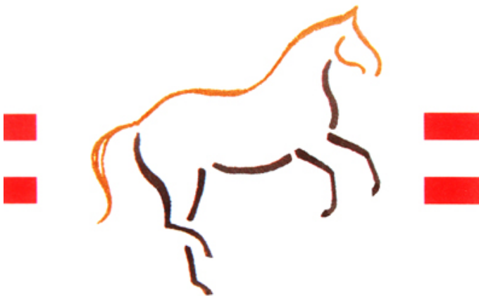
Logo des Bundesvereins Ländlicher Reiter in Österreich - 2008